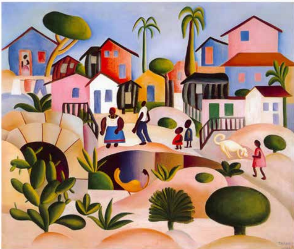
DO AMARAL, Tarsila. Morro da Favela. 1924.

Tarsila do Amaral foi uma artista que nasceu na cidade de Capivari-SP. Sempre gostou de estudar e pintar sobre a arte brasileira.